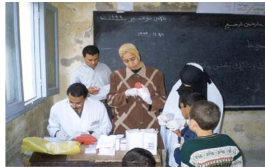
Controllo dell'anemia nei bambini delle scuole

Consiste nell'utilizzo di uno spettrofotometro portatile "HemoCue Test" per l'emoglobina,