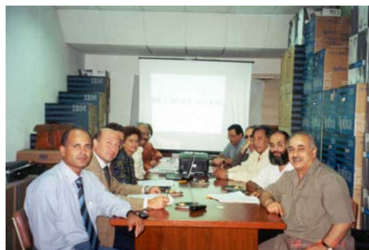
Team al lavoro per l'analisi delle informazioni raccolte e la relativa pianificazione

Per ciascuna specie di elminti e per l'anemia sono stati formulati obiettivi specifici. Le attività sono state definite e pianificate in modo da integrarsi facilmente con il sistema sanitario del Governatorato.