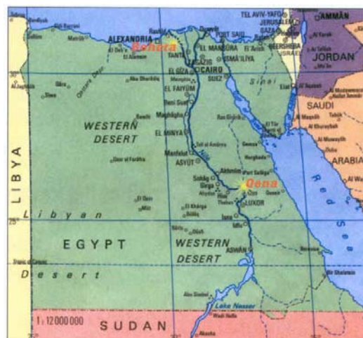
Mappa dell'Egitto con le aree geografiche di intervento (Governatorato di Behera e Governatorato di Qena)

consolidare e migliorare l'impatto e la visibilità delle esperienze tecniche bilaterali sin qui maturate dalla Cooperazione Italiana nel Paese. L'impatto sui beneficiari potrebbe essere ancora più incisivo se, come evidenziato più volte, anche gli interventi finanziati attraverso il Debt Swap , potessero contare sull'assistenza tecnica specifica fornita da un esperto Italiano del settore a tempo completo.