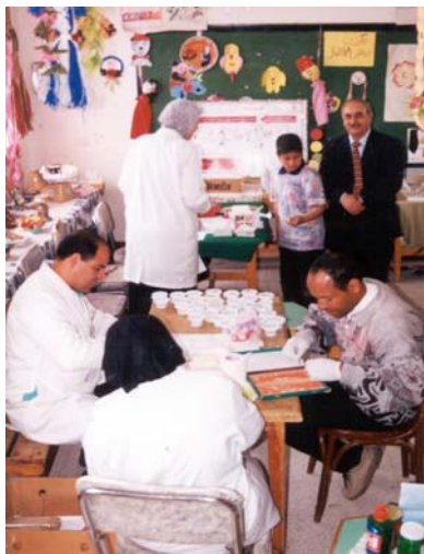
Team al lavoro per le analisi parassitologiche e il controllo emoglobina nei bambini delle scuole

L'obiettivo del piano di azione era quello di sostenere il NSCP che si andava realizzando in Egitto, attraverso la messa a punto di un migliore sistema di monitoraggio, e l'integrazione di altre attività di controllo sulla base dei risultati ottenuti dalla baseline survey , come il controllo delle infezioni da elminti, dell'anemia e della fascioliasi.