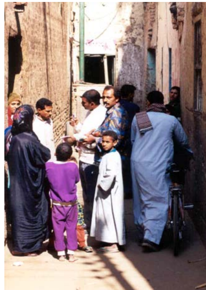
Visita casa per casa durante la baseline survey