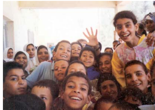
Bambini delle scuole elementari

Sulla base dell'esperienza maturata dal programma di medicina scolastica nel Governatorato di Behera sono state formulate alcune raccomandazioni operative che possono servire da linea guida per lo sviluppo di altri interventi della Cooperazione Italiana in paesi in via di sviluppo.