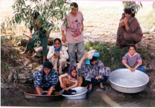
Donne e bambini al canale dove si contraggono molte delle infezioni da elminti

Nonostante non esistessero dati sulla prevalenza delle infezioni da elminti nella popolazione di questo Governatorato, molti dei medici del MoHP in Cairo e in Qena consideravano questa patologia come uno dei maggiori problemi di salute pubblica dell'Alto Egitto.