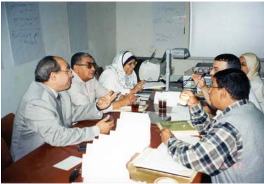
Team nazionale al lavoro per la definizione delle strategie per il controllo delle elmintiasi in base al costo-beneficio

Il costo totale dell'intero intervento di un anno per il controllo della trasmissione delle infezioni da elminti e il monitoraggio delle infezioni da schistosoma, escludendo i costi dell'assistenza tecnica del personale della Cooperazione Italiana e della OMS, si aggirano intorno alle 73.000 Lire Egiziane (LEG), che al cambio del 2002 ammontano a poco meno di 15.000 €, rappresentando meno del 20% del budget totale che il NSCP destina al Governatorato di Behera per il controllo della Schistosomiasi.