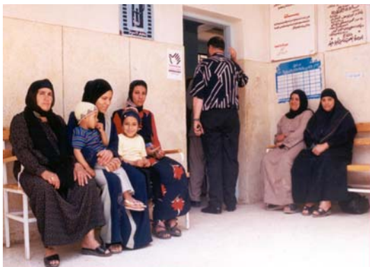
Intervento di medicina scolastica integrato alle attività dei centri di salute di base