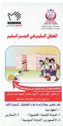
Fronte-pagina del foglietto informativo

E' stato anche prodotto un foglietto informativo che spiega come e' possibile evitare reinfezioni da elminti.