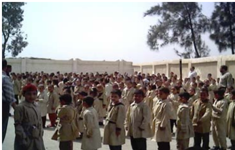
Alunni alla scuola elementare

L'Egitto e' in una situazione particolarmente favorevole per la realizzazione d'interventi di medicina scolastica. Infatti negli ultimi anni il Paese ha drasticamente ridotto i tassi di mortalità infantile, che e' attualmente stimata intorno al 54/1.000; contribuendo anche una notevole crescita della popolazione in età scolastica.