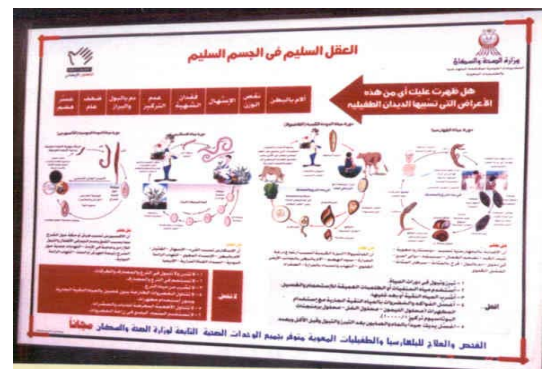
Poster divulgativo sul ciclo e sintomatologia delle infezioni da elminti

Difficilmente la situazione puo' ulteriormente migliorare solo con la somministrazione di farmaci antielmintici, conseguentemente il programma sta dando molta rilevanza alle campagne di informazione/educazione per la salute. Un poster divulgativo e' stato elaborato e largamente distribuito a tutte le scuole, moschee e centri di salute del Governatorato.