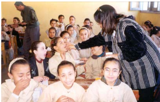
Somministrazione di medicinali anti-elmintici nelle scuole

Sulla base di questo criterio vengono identificate ogni anno 35 "clusters" ciascuno di almeno 50 bambini della classe terza elementare. I dati vengono raccolti attraverso la tecnica del Kato-Katz, sei mesi dopo la terapia anti-schistosoma ed anti-elmintica, dando un tempo sufficiente per eventuali reinfezioni.