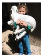
La tutela dell'infanzia è uno dei settori in cui è impegnato il Debt Swap.

delle organizzazioni della società civile egiziana e delle ONG italiane.