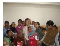
"Protezione dei bambini lavoratori": uno dei 53 progetti finanziati dal Programma di Conversione del Debito

Le testimonianze offerte dalle donne beneficiarie del progetto hanno inoltre evidenziato non solo la loro accresciuta autonomia nella gestione del loro reddito, ma anche la loro regolarità nella risoluzione del debito contratto.