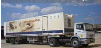
The Mobile Information Technology Club

Inoltre, nel quadro dello sviluppo della tecnologia e della comunicazione nelle scuole, sarà inaugurata l'apertura di un cospicuo numero di " Smart School " allo scopo di favorire l'istruzione con l'introduzione di computer in alcune scuole appartenenti ad aree povere.