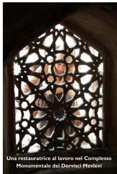
Una restauratrice al lavoro nel Complesso Monumentale dei Dervisci Mevlevi

Ma non ci montiamo certo la testa: continueremo ad informarvi, raccogliendo i contributi di quanti operano nel nostro settore, con lo stesso entusiasmo e con la speranza che questo strumento, nella sua semplicità, continui ad avere il vostro apprezzamento.