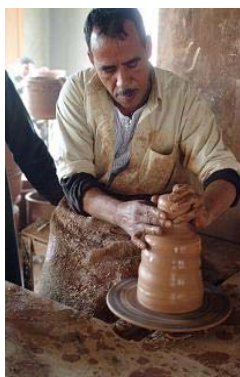
Particolare attenzione è prestata alla Lotta alla Povertà, mediante l'erogazione di micro-prestiti a favore, tra l'altro, di attività artigianali.