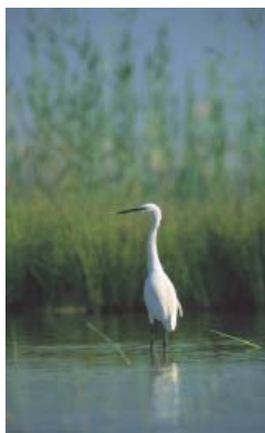
Area Protetta di Wadi El Rayan: una delle componenti del Programma Ambientale Italo—Egiziano

Questo processo avviato dal Ministero delle Politiche Agricole, è andato quindi a soddisfare l'esigenza socio-politica italiana di controllo di flussi migratori, e allo stesso tempo ha favorito le richieste delle imprese agro-alimentari del nostro paese e degli immigrati, che hanno fatto della stagionalità un'occupazione integrativa di quella in patria.